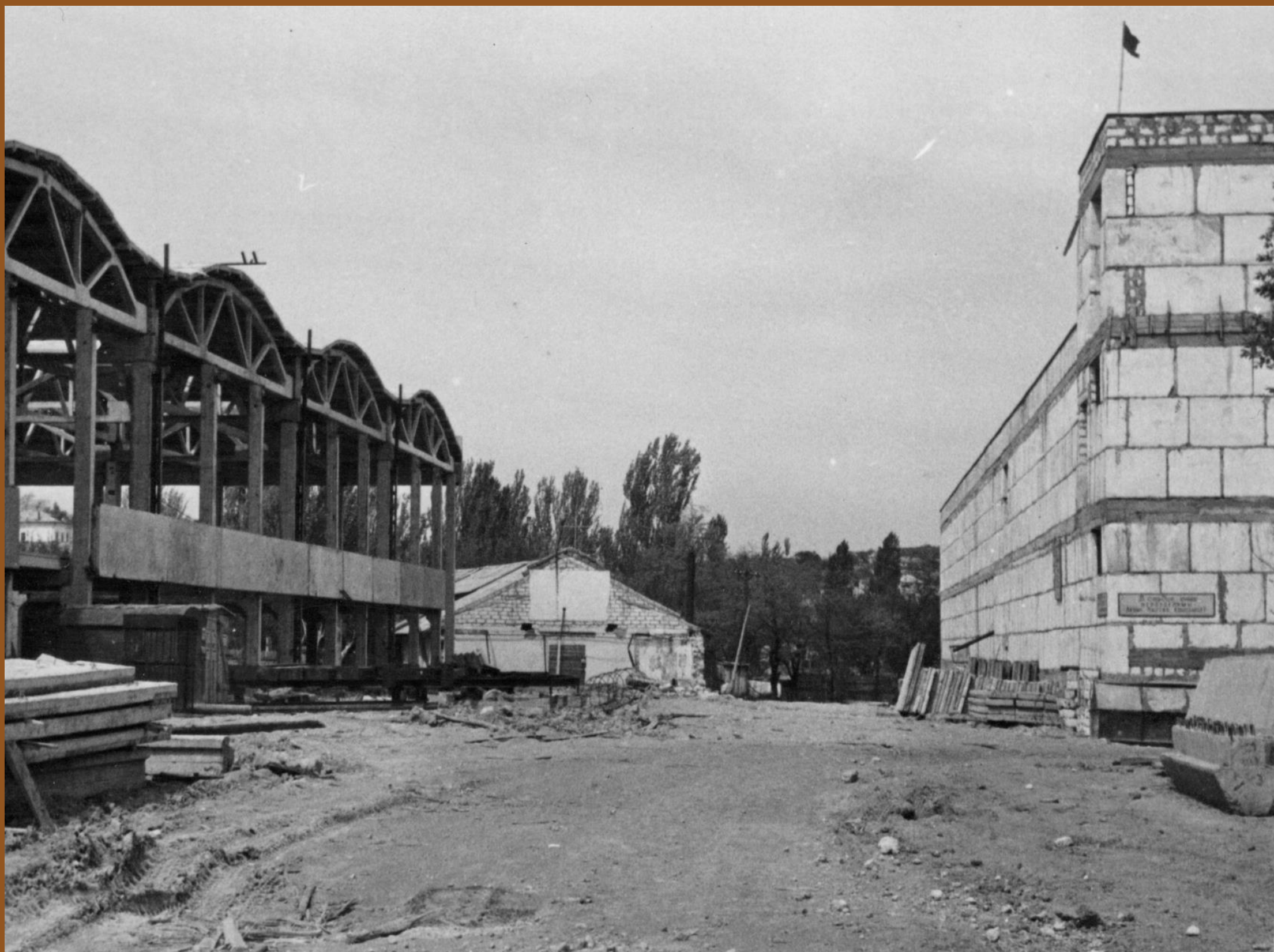
Строительство корпуса завода «Парус» 1968 г. Фото