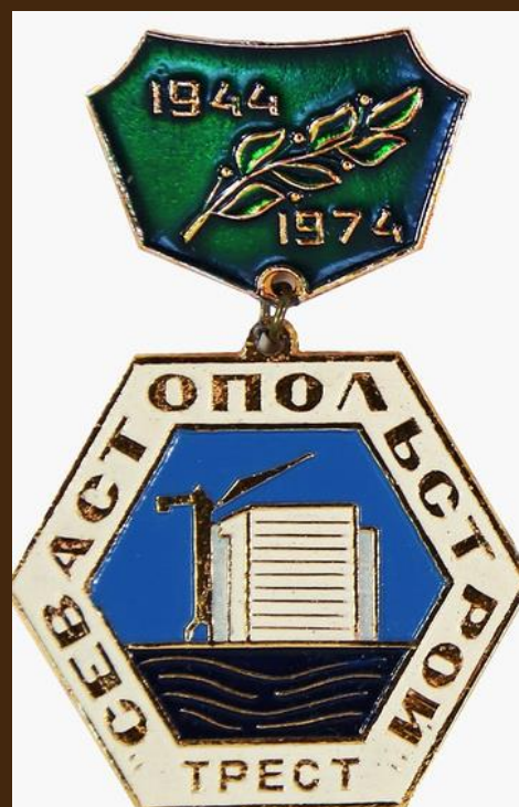
Юбилейный значок. Трест «Севастопольстрой». 1944 –1974 гг. Выпущен к 30-летию треста.