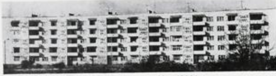
20-этаж. жилой дом по ул. Некрасова, построенный бригадой Е.А. Реброва.

„Всемерно развивать инициативу, деловитость, творческий поиск резервов и возможностей роста производства, обеспечить высокую организованность и исполнительскую дисциплину на каждом производственном участке“. Из проекта ЦК КПСС к XXVI съезду партии „Основные направления экономического и социального развития СССР на 1981—1985 годы и на период до 1990 года“.