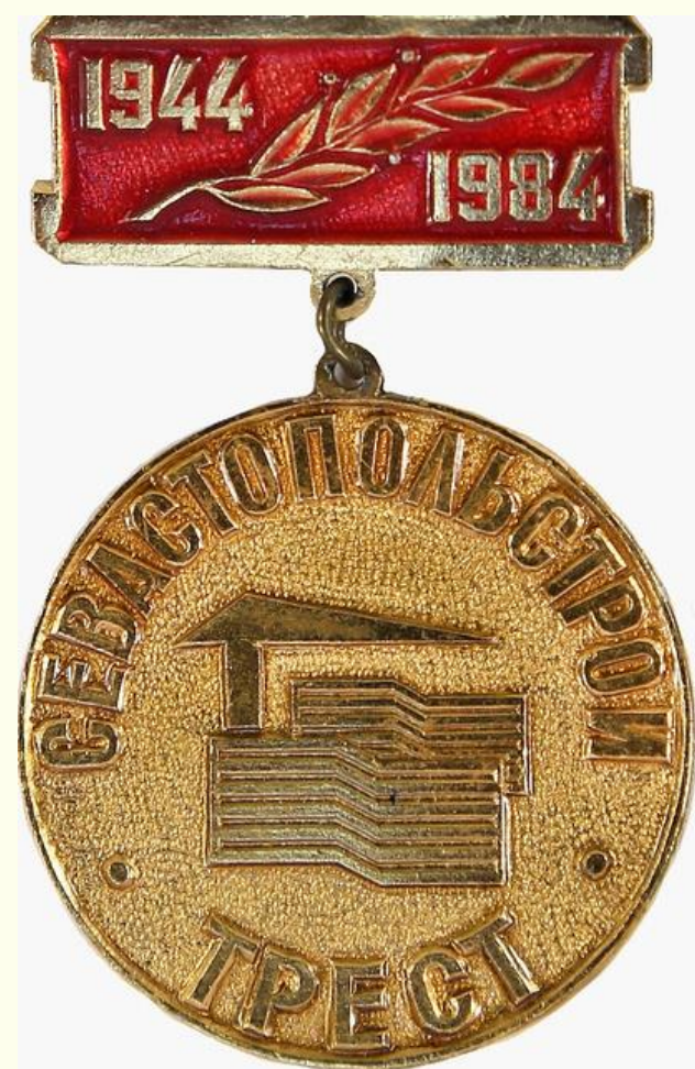
Значок юбилейный. Трест «Севастопольстрой» 1984 г.